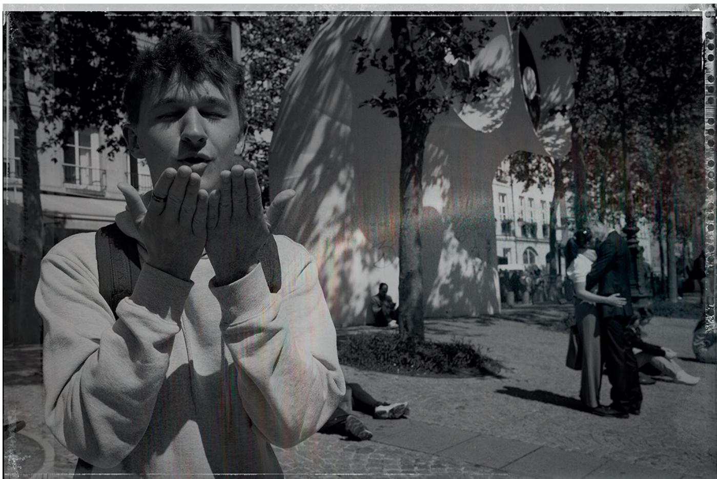
Hommage à Doisneau «Le baiser de Beaubourg» Ils rêvent encore d'un autre monde !