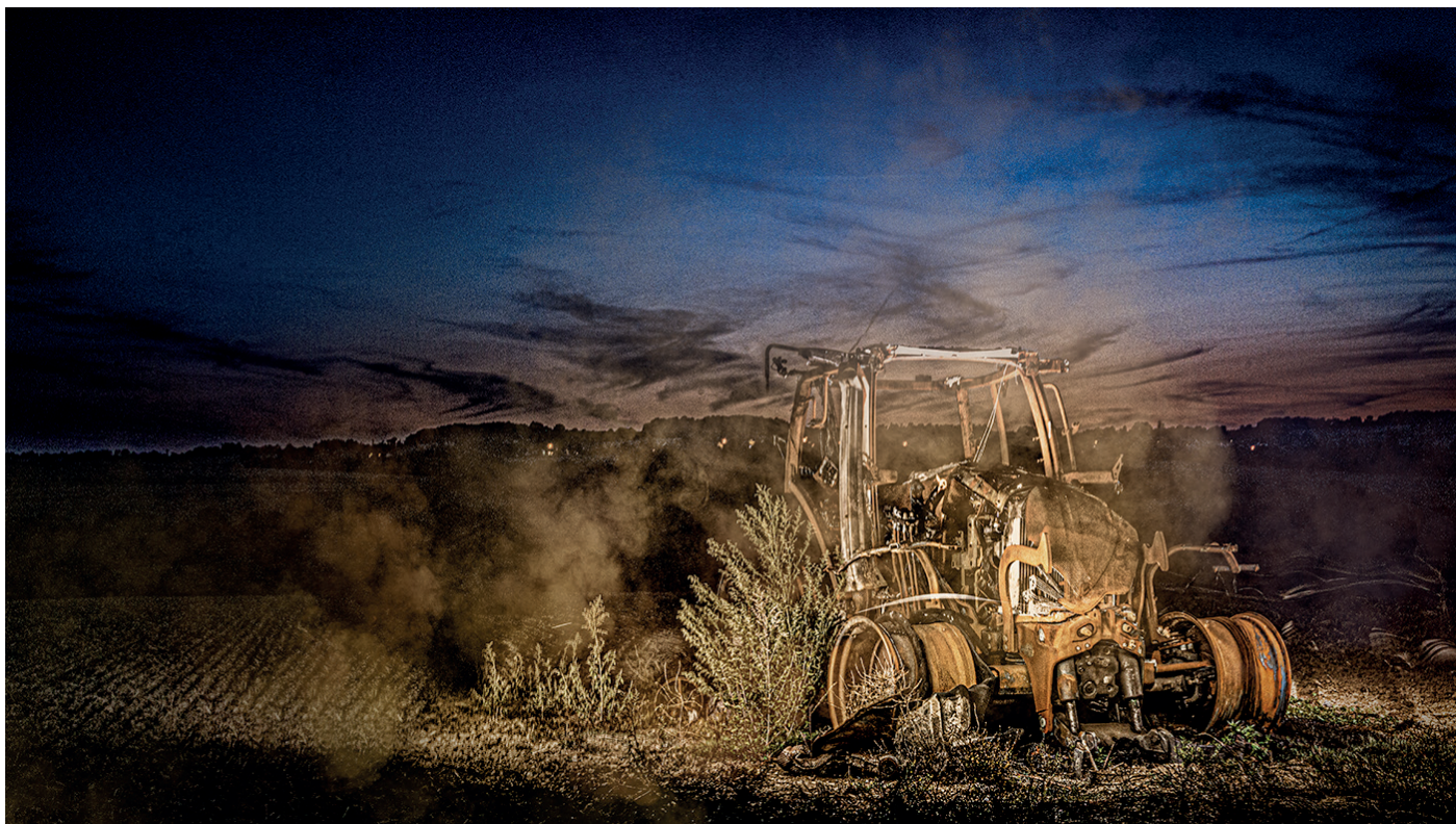
Est-ce bien encore notre monde ?