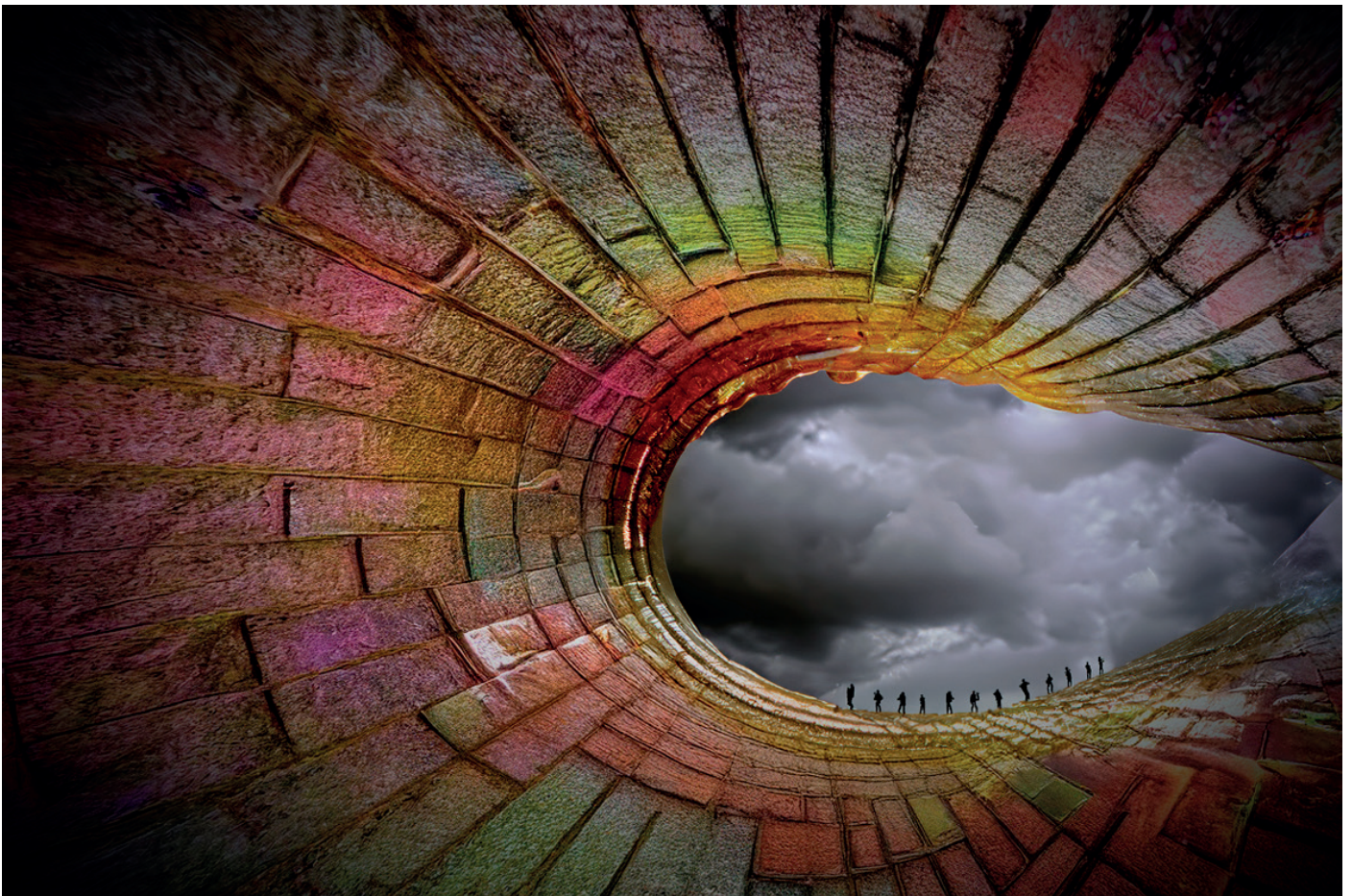
Théorie des espaces courbes