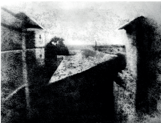
Point de vue du Gras. Premier cliché photographique de Nicéphore Niépce pris en 1826-1827

Il y a 200 ans, surgissait une nouvelle technique de l'image, une invention qui allait donner un art neuf : la photographie .